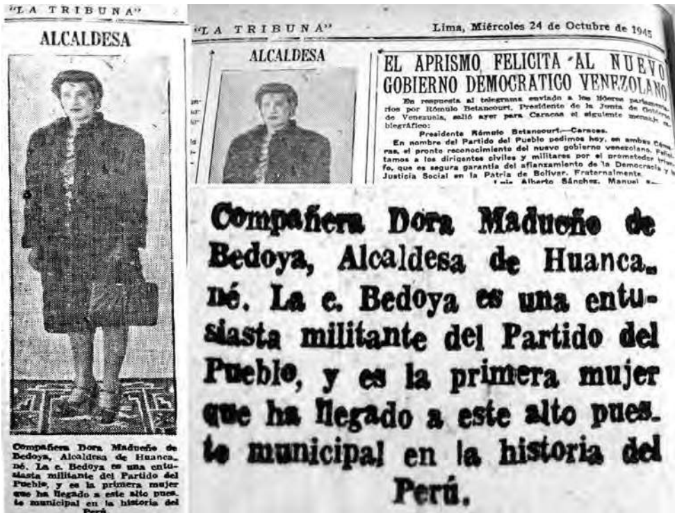
Dora Madueño de Bedoya, primera alcaldesa del Perú en 1945