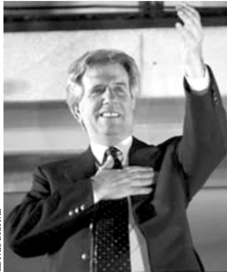
EL PAÍS DIGITAL

Aun cuando faltan ajustar algunas cifras, en el Senado e incluyendo al vicepresidente Nin Novoa, el MP – FA tendría 17