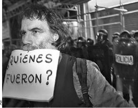
Protestas durante comicios: la ciudadanía no perdonó al PP el aparente manejo político del atentado en Madrid.

La de Diputados está compuesta por 350 escaños distribuidos, primero, a razón de dos por cada una de las cincuenta provincias existentes en el país (a excepción de Ceuta y Melilla que eligen uno cada una). Las restantes 248 curules se reparten entre las cincuenta provincias en proporción a su población.