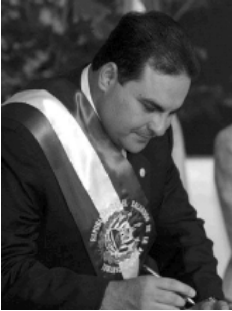
Antonio Saca, nuevo presidente.