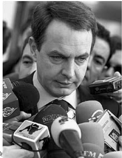
J. L. Rodríguez Zapatero, líder del Partido Socialista Obrero Español y nuevo presidente del Gobierno español.

Lejos quedaron Convergencia i Unió con diez escaños, Esquerra Republicana de Catalunya con ocho, el Partido Nacionalista Vasco en alianza con Eusko Alkerdi Jeltzalea con siete, y Coalición Canaria con tres.