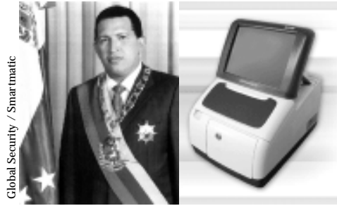
Global Security / Smartmatic