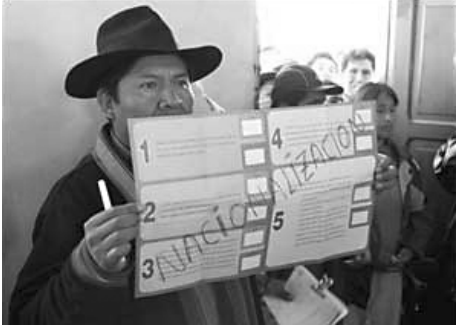
Votantes a favor de la nacionalización.

La consulta se llevó a cabo el domingo 18 de julio y supuso un eventual triunfo del sí en cada una de las cinco preguntas registradas en la papeleta, aun cuando al cierre de esta edición (22 de julio) faltaban contabilizar los resultados de un 21,54% de mesas por parte de la Corte Nacional Electoral.