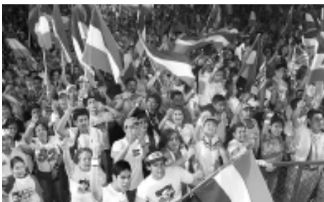
Celebración arenista durante la noche de elecciones.

Los comicios se realizaron el 21 de marzo y dieron como ganador y nuevo presidente al arenista Antonio Saca. El cómputo final del Tribunal Supremo Electoral salvadoreño registró 57,71% de los votos válidos para la Alianza Republicana Nacionalista (ARENA), y 35,68% para su principal competidor, el Frente Farabundo Martí para la Liberación Nacional (FMLN).