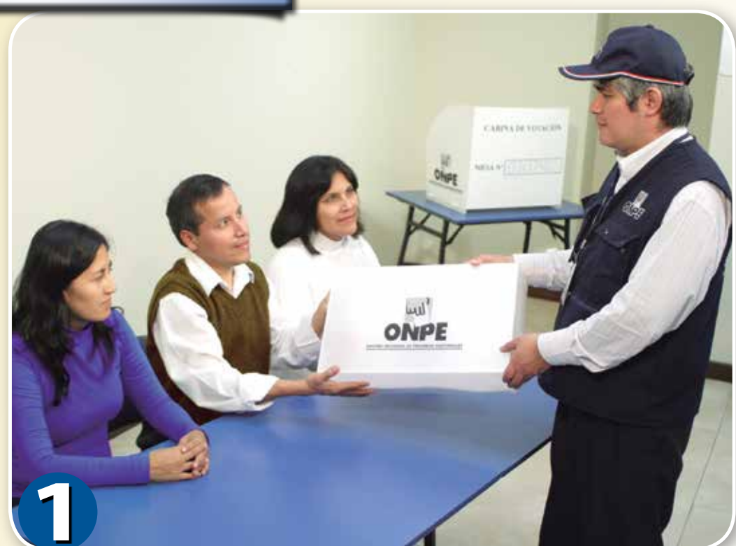
1 Recibir el ánfora y revisar el material.