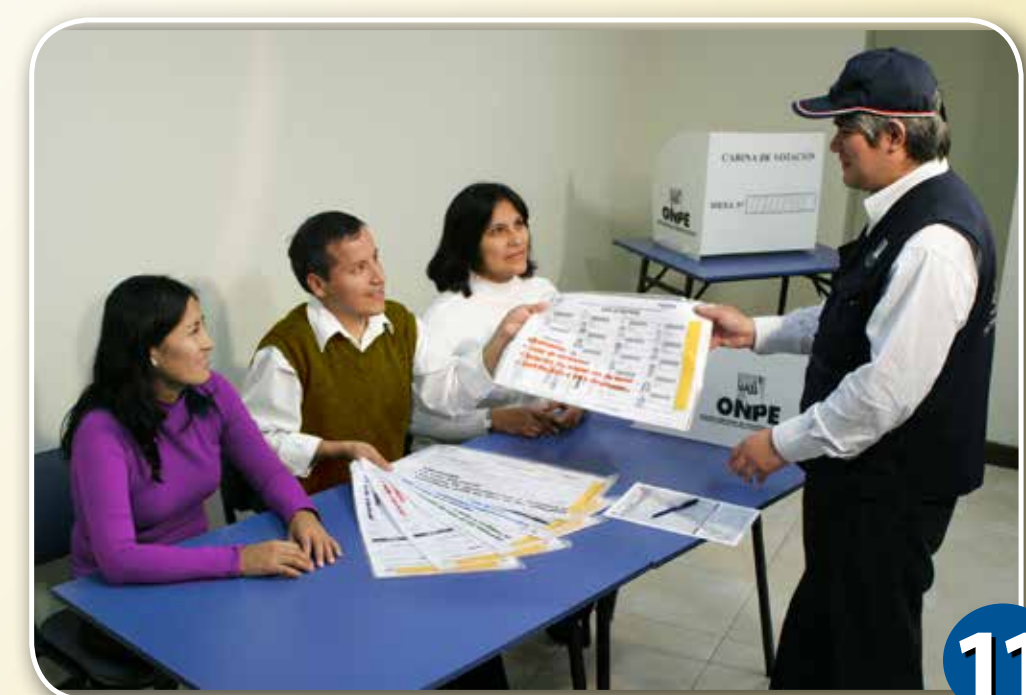
11 Entregar los sobres de colores y el sobre anaranjado al coordinador de la ONPE.

En los distritos de Conchucos, Huacachuque, Santa Rosa y Tauca de la provincia de Pallasca (Áncash), así como en los de Condormarca y Ucuncha de la provincia de Bolívar (La Libertad), se entregarán dos cédulas a cada elector: una para la consulta provincial y otra para la consulta distrital. Es tarea de los miembros de mesa indicar al elector que, luego de votar, deposite la cédula provincial en el ánfora con marco morado y la cédula distrital en el ánfora sin marco (pasos 4 y 6).