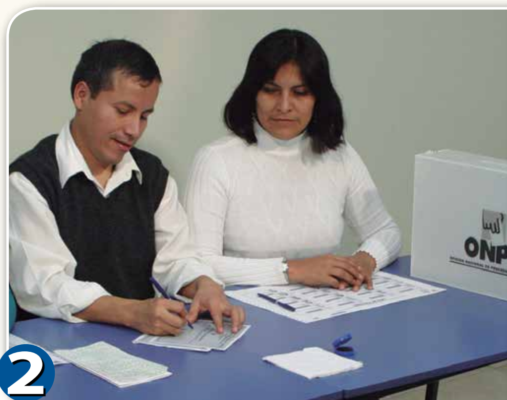
2 El presidente firma las cédulas de votación. Pegar la Relación de Electores fuera del aula.