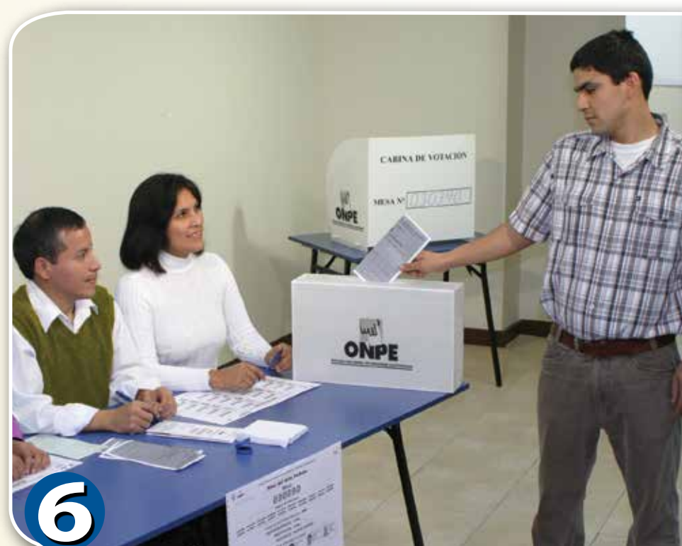
6 Verificar que el elector deposite la cédula en el ánfora. Indicar que firme y coloque su huella en la Lista de Electores.