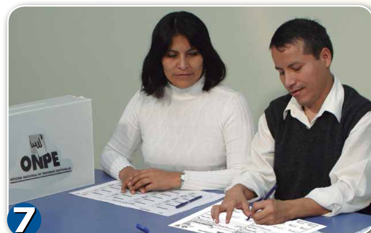
7 Pegar el holograma en el DNI del elector. Finalizada la votación llenar y firmar las Actas de sufragio.