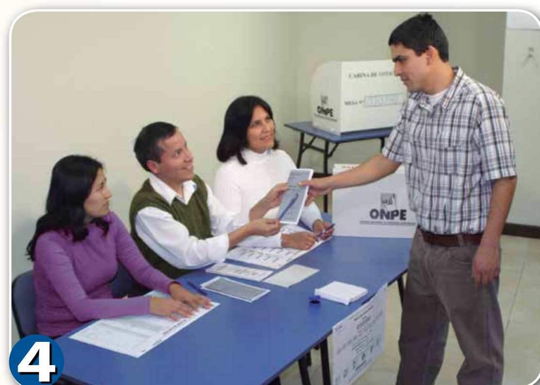
4 Verificar los datos del elector y entregar la cédula.