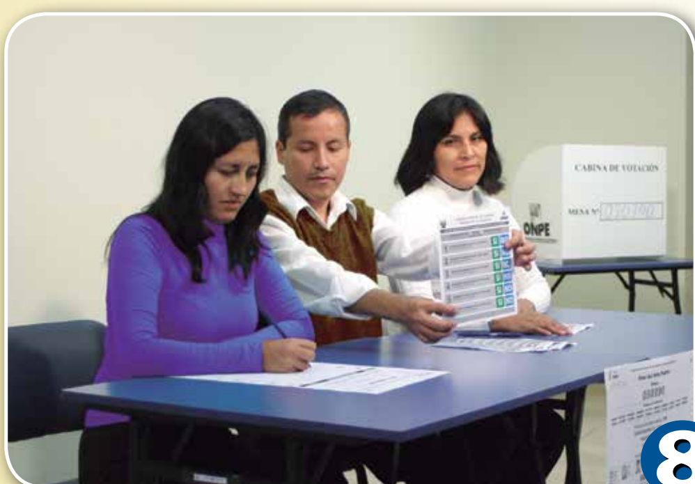
8 Contar los votos y colocar los resultados en la Hoja Borrador.