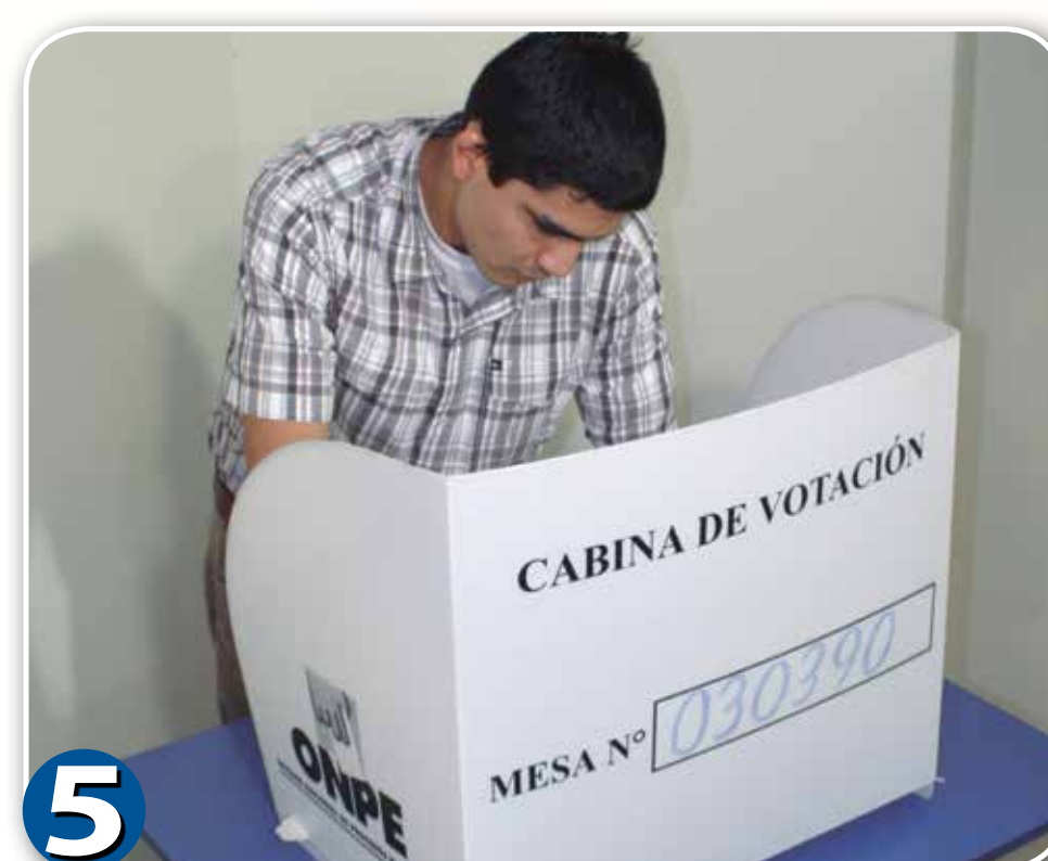
5 Indicar al elector que ingrese a la cámara secreta.