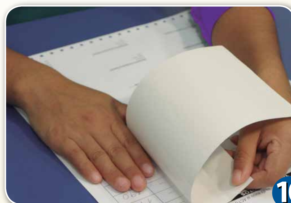
10 Cubrir los resultados con las láminas transparentes. Guardar las actas en los sobres plásticos.