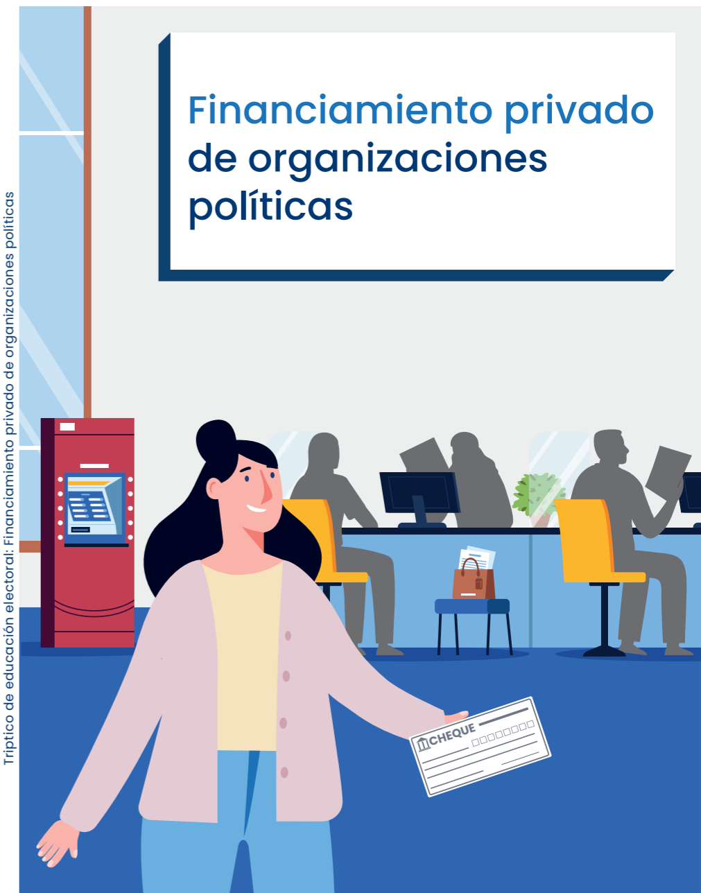
Triptico de educación electoral. Financiamiento privado de organizaciones políticas